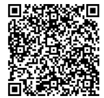
厚生労働省QRコード